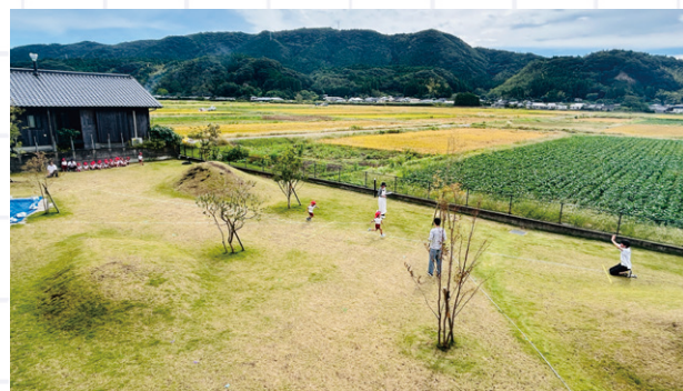
芝生の園庭で25m走 (6種類の体力テストで園児の運動能力を計測)

専門はこども施設の建築計画学。 こどもの体力が向上する園舎、遊びが発展しやすい遊びコーナーづくり、木の園舎の保育的效果、建物を教材とする学校ワークショップなどの研究を行う。これまでに石川高専で教育や研究、日比野設計「幼児の城」で保育施設の設計に携わってきている。