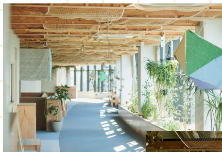
渋谷東しぜんの国こども園内の路地。路地で人と人がクロスする。

保育の実践では、日々、森の循環システム「里山文化」を体現するプログラムや、表現、食を基盤とした毎日の暮らしを行っている。作曲・演奏家としても活動しており、様々な場所での音楽ワークショップ、他ジャンルのアーティストとのコラボレーションを行う。季刊誌BALLADをプロデュース。和光高校「保育と教育」非常勤講師。