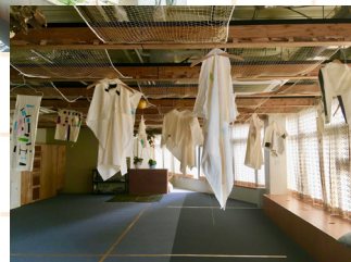
渋谷のA/Parallelブランドとのワークショップ