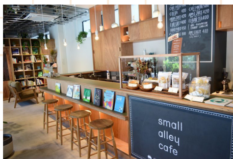
渋谷東しぜんの国こども園の1階にあるカフェ

【主催】 一般社団法人 園Power http://www.en-power.org/ 【お問合せ】 enpower.org@gmail.com 【協力】 合同会社 MichiLab