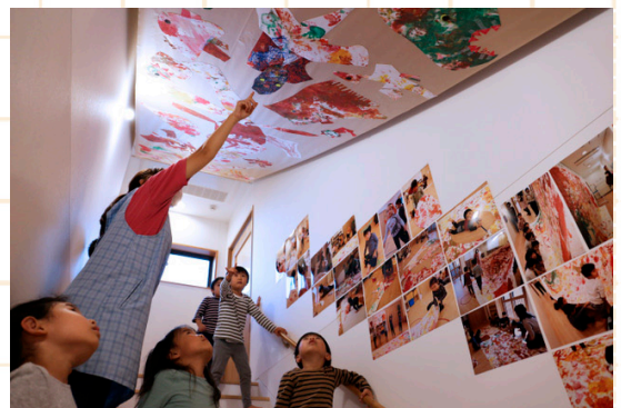
グローバルキッズ大岡山園での美術ワークショップ