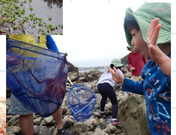
子どもは未知の世界と出会い、感じて学んでいる