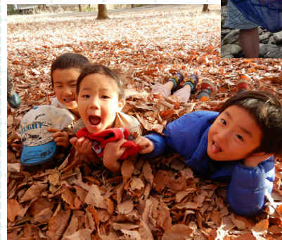
1年中、外生活 森のようちえんスタイルの保育