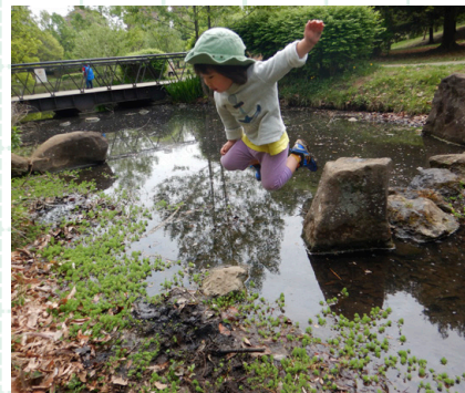
都会の自然環境にて、それぞれが「したいこと」を選んで遊ぶ

1971年神奈川県生。1998年ニュージーランドに渡り国立公園にて現地ガイドとして働く。その後パタゴニア日本支社を経由し、2004年に帰国後アウトドアオペレーターの事業を立ち上げ、2007年NPOもあなキッズ自然楽校設立。2009年に森のようちえんスタイルの保育園を開園。現在神奈川県内に6つの園と1学童保育施設を運営。0歳児から小学生までの自然体験活動を実践している。