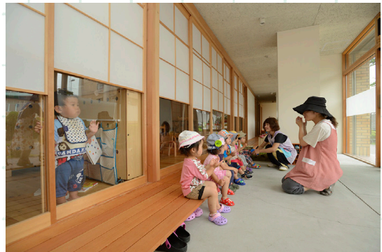
園児の活動に寄り添った玄関土間（木もれ陽保育園）