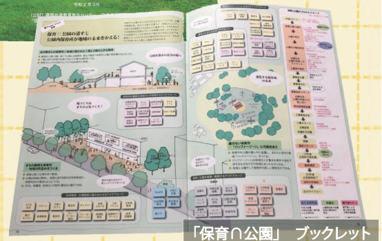
「保育の公園」ブックレット