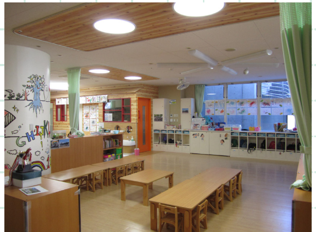
▲テナントビルに入居する調査対象園

専門は建築環境工学、住環境教育。近年は都市部の保育施設の住環境の課題や、高齢年団地の温熱環境と健康リスクに関する調査研究に取り組む。また、住環境リテラシー醸成のための学習プログラムの開発や支援を行う。