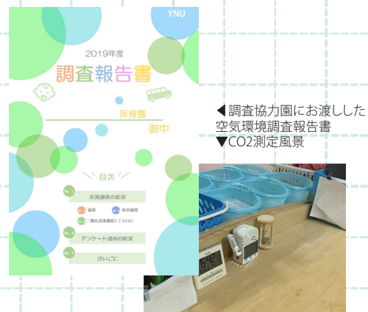
◀調査協力園にお渡しした 空気環境調査報告書 ▼CO2測定風景