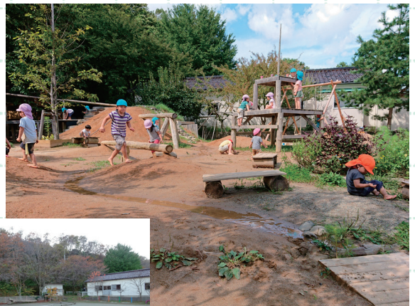
三瀬保育園(山形県鶴岡市) ◀改修前(左)、▲改修後(上)の園庭

名古屋工業大学大学院、東京工業大学大学院を経て、1996年東京工業大学助手となる。仙田満に師事、こどものあそび環境や幼児環境、住環境などについて調査・研究するとともに、幼児施設、医療施設、遊具、住宅などの計画・設計に携わる。2005～15年 環境デザイン研究所に勤務。2016年 一級建築士事務所Integral Design Studio 設立。2018年 法人化。現在、株式会社Integral Design Studio代表取締役。