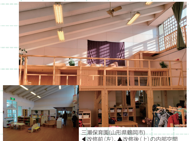
三瀬保育園(山形県鶴岡市) ◀改修前(左)、▲改修後(上)の内部空間