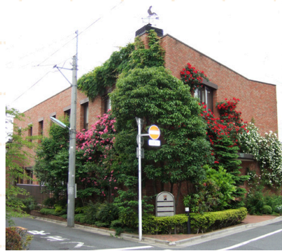
東京子ども図書館 レンガづくりの外観。 6月には赤と白のバラが咲く。

石井桃子や松岡享子らが開いた家庭文庫を母体に、1974年に設立。 子どもたちへの直接サービスの他、「子どもと本の世界で働くおとな」のために、資料室の運営、出版、人材育成など、様々な活動を行っている。