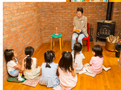
おはなしのへや。 ろうそくに火を灯して。