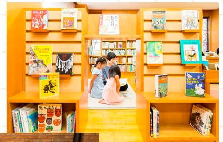
児童室。好きな本を好きな だけ読んでもらう。