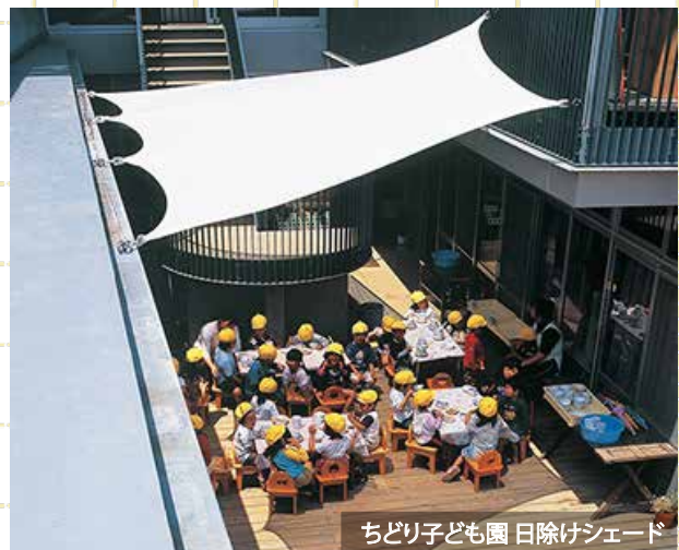
ちどり子ども園 日除けシェード