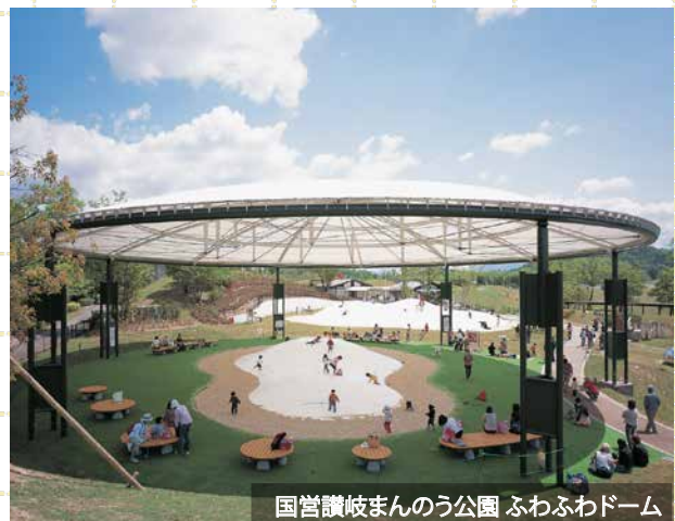
国営讃岐まんのう公園 ふわふわドーム

30年前から膜製トランポリン「ふわふわドーム」の販売をスタート。全国の公園で人気のアイテムとなり、これまでに160か所へ設置。子どもの遊びと成長におけるテントの可能性を追求して、2019年に遊び場コンサルオフィスを新設。