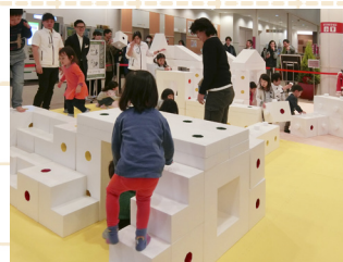
▲(上) あまねの杜保育園 ▲(中) てぞーろ保育園 ◀(左) みなもブロック